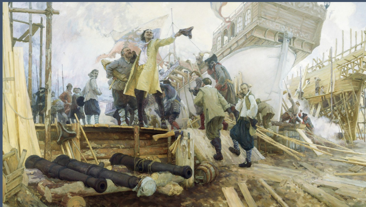
Ю. Куцевский «Новое в России дело» (Спуск галеры «Принципиум» на воронежской верфи 3 апреля 1696 г.)