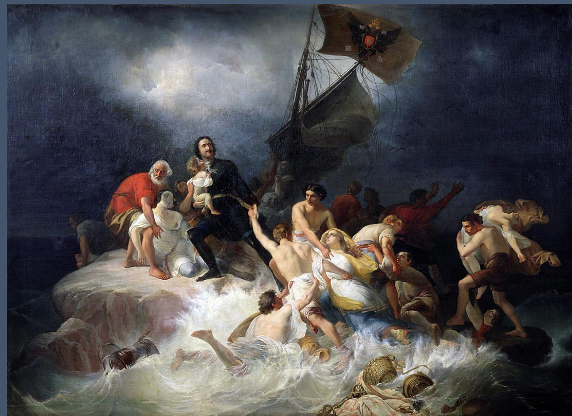
П. М. Шамшин «Петр Великий спасает утопающих на Лахте», 1844 г.