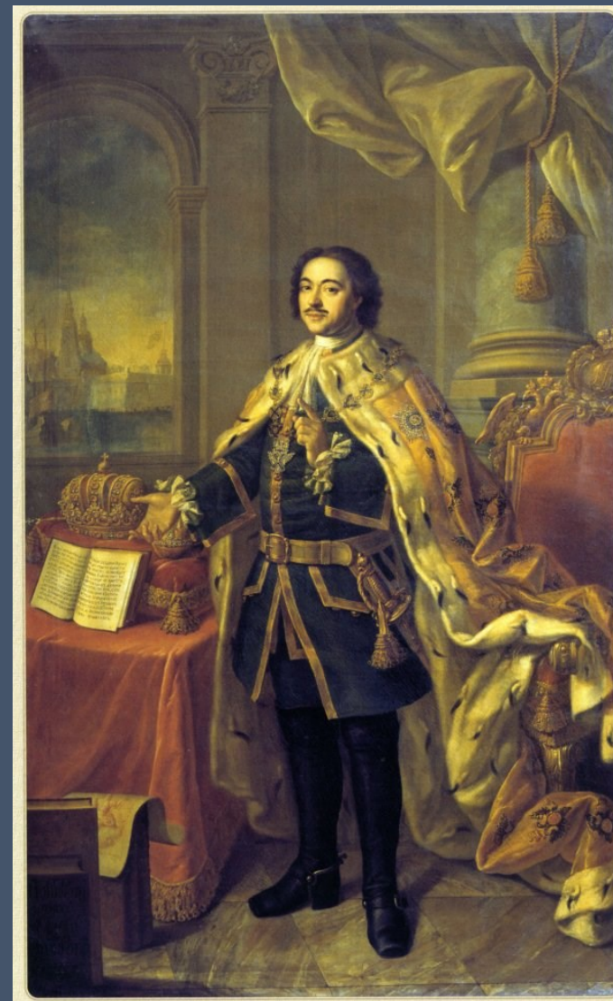
Алексей Антропов «Петр I», 1770 г.