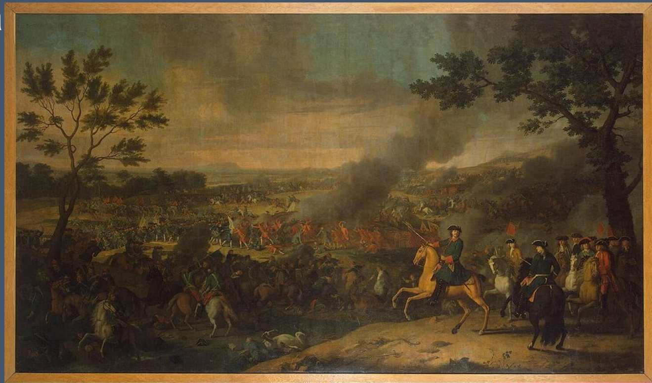
Л. Каравак «Петр I в Полтавской битве», 1718 г.