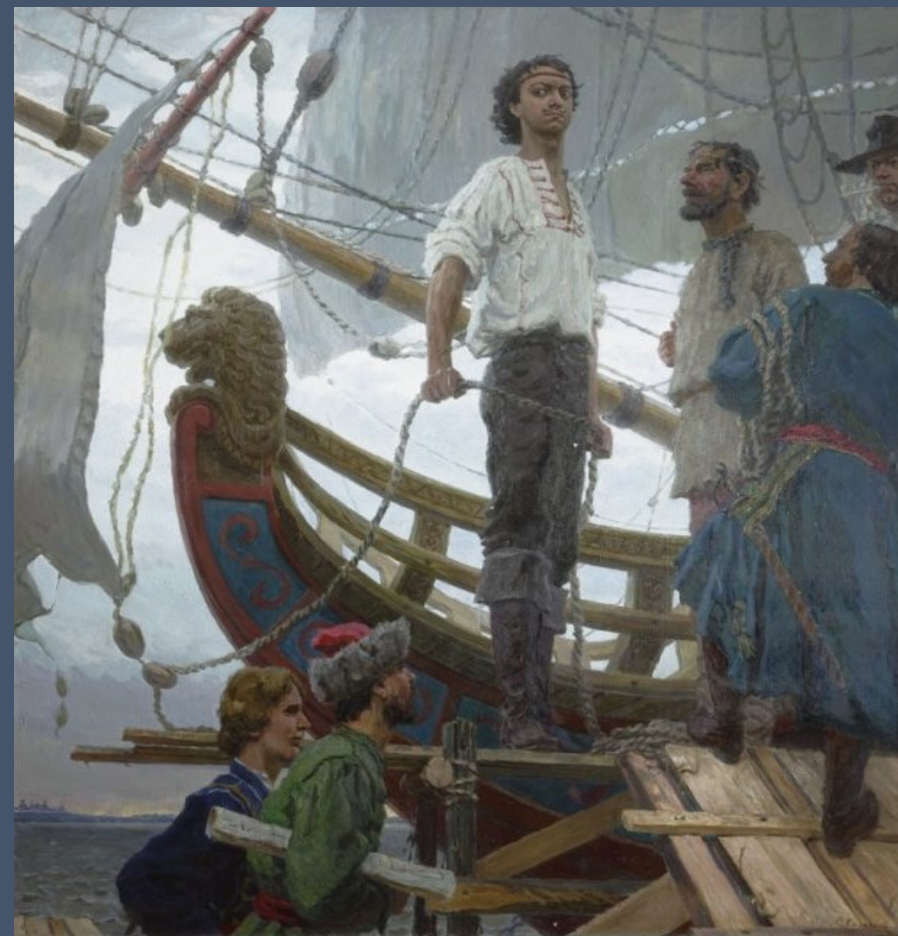
С. Кириллов «Морским судам быть! (Петр I)», 1985 г.