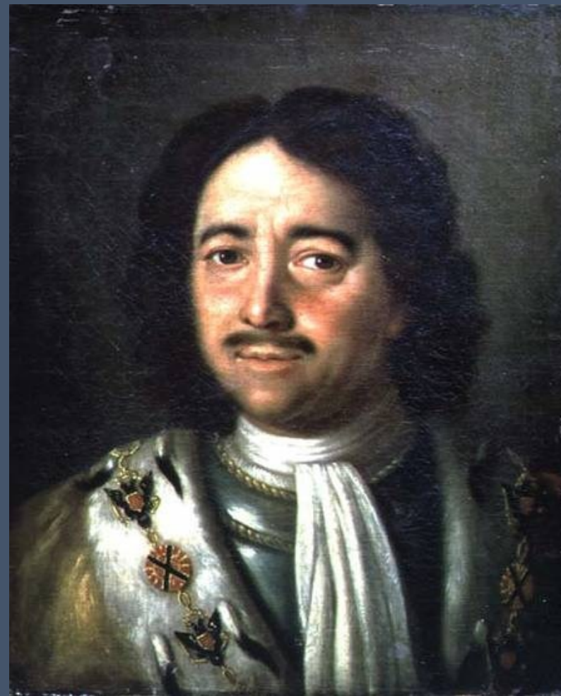
А. П. Антропов. Портрет Петра I.